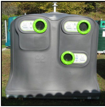
Colonne à verre qui sera installée en face de la salle des fêtes

Pour le verre, il faudra que vous l'ameniez dans les colonnes à verre qui seront positionnées au 1er trimestre 2015 dans votre commune. En fonction de votre consommation, vous vous y rendrez autant de fois que vous le souhaitez. Le verre ne peut pas être collecté en mélange avec les autres emballages ménagers car le centre de tri ne peut pas le trier et les débris de verre empêchent le recyclage des autres emballages. De même, le verre ne peut pas être mé- langé avec les ordures ménagères car il ne brûle pas et en plus il est recyclable à l'infini lorsqu'il est collecté séparément. D'où ce mode de collecte particulier grâce aux colonnes à verre. Le tri des déchets pour un meilleur traitement et une valorisation satisfaisante est essentiel ; avec ce nouveau dispositif toutes les conditions seront réunies, pour y parvenir. La distribution des containers se fera le samedi 7 février à partir de 9h à 12 heures à la salle des fêtes. La C.C.L-O va vous informer par un courrier individuel. Les personnes qui auraient des difficultés pour récupérer leur container doivent contacter le secrétariat de mairie. Nous comptons sur vous.